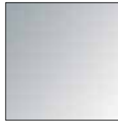
Aluminium poliert Polished aluminium